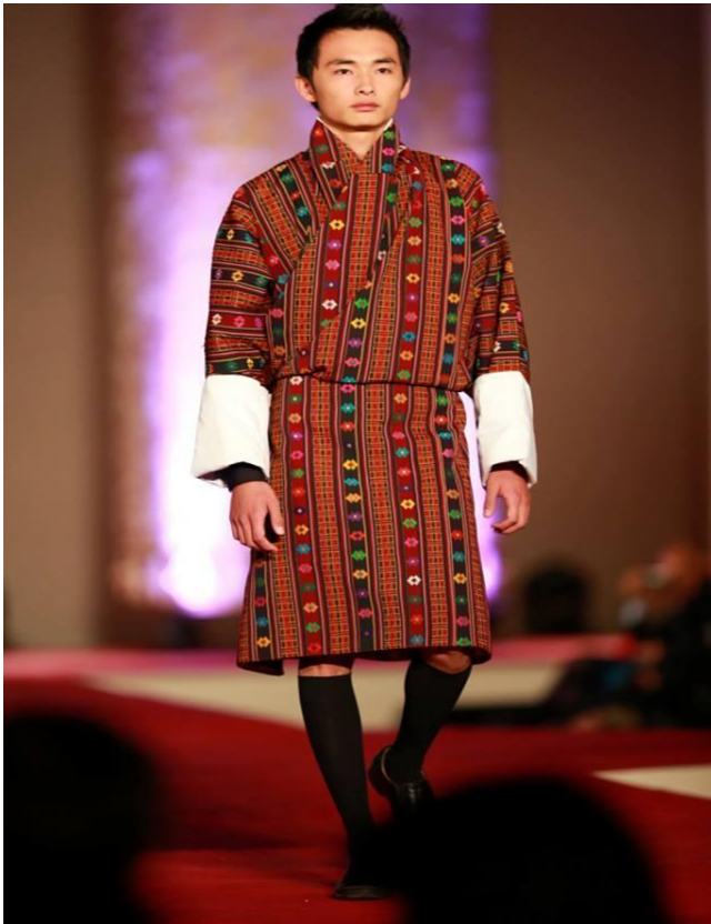
National Dress – Men