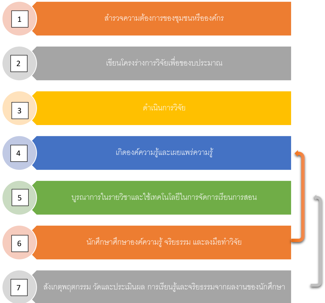
ภาพที่ 2 : วิธีการดำเนินกิจกรรม